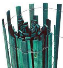
Clôture de bois