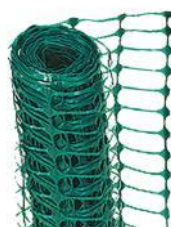
Clôture de plastique